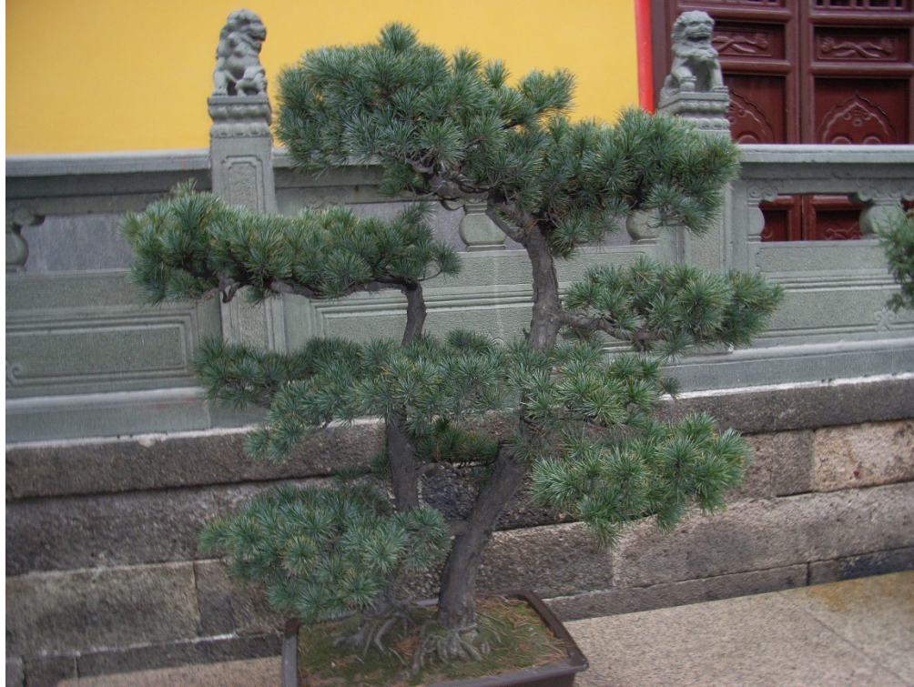
Bonsai, Peking 2008